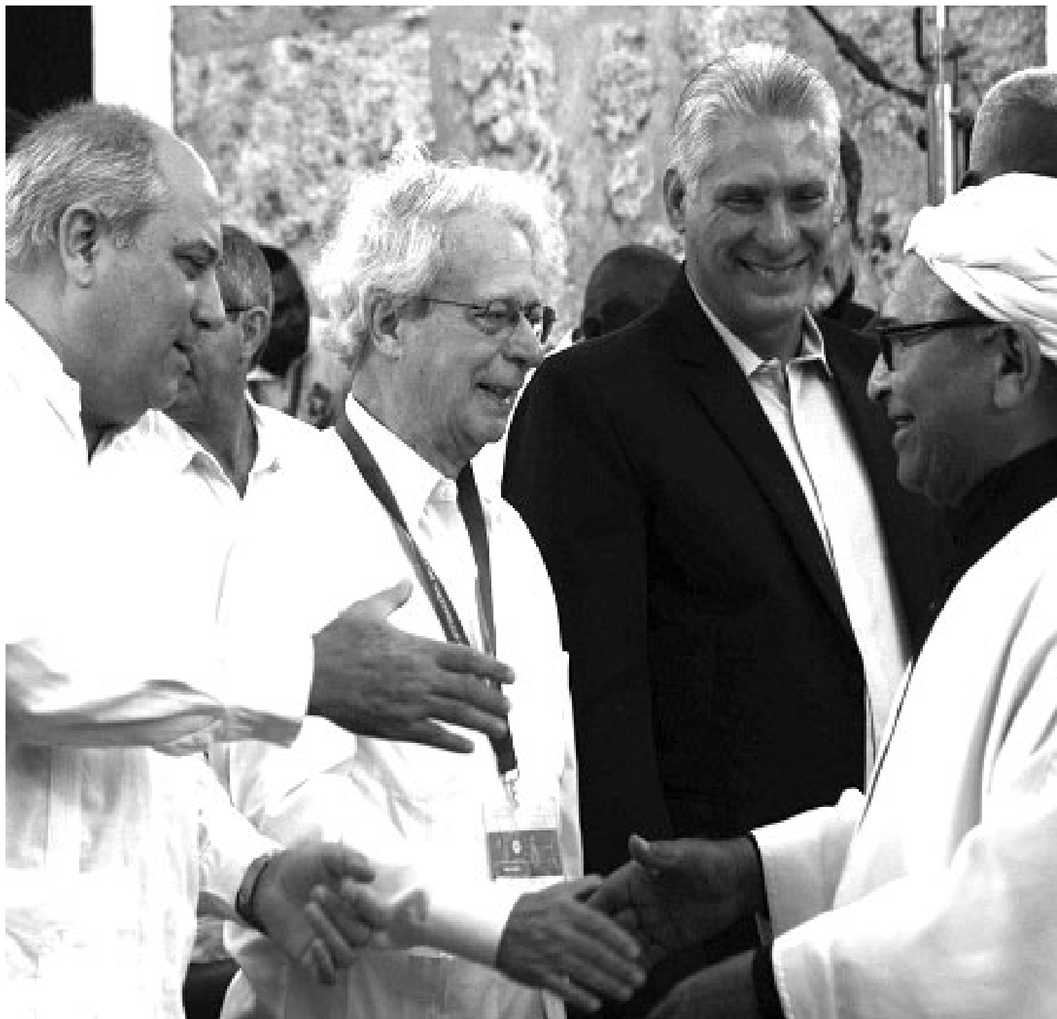
El presidente cubano intercambió con personalidades asistentes al acto inaugural