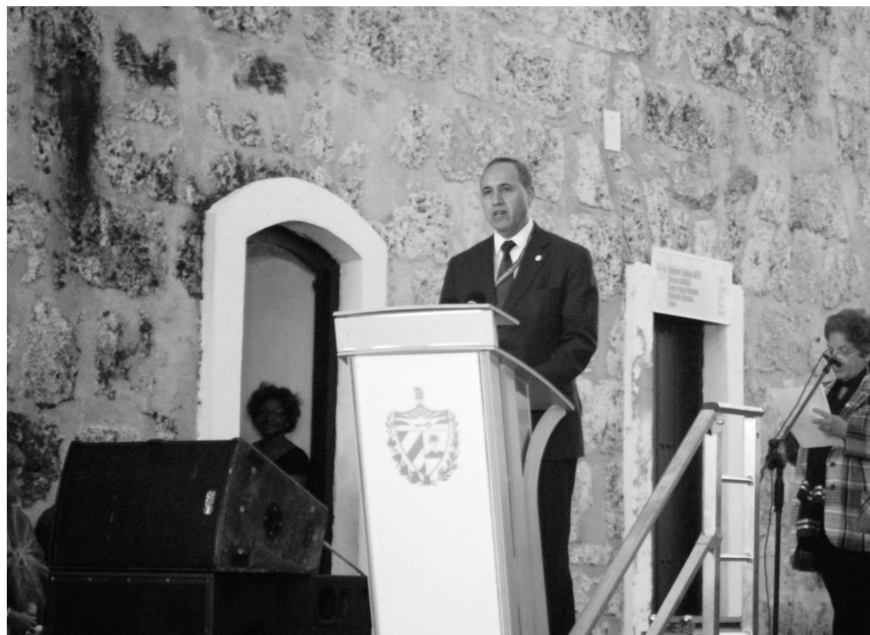
"Esto no nos extraña del hospitalario pueblo cubano", significó el ministro argelino de Cultura al referirse a la cálida bienvenida a la Feria.

Danzando entre puentes , título de una de las piezas musicales de su autoría, interpretadas en el acto inaugural, encarna ese espíritu de la Feria de sobrevolar toda barrera en busca de lo que nos conecta.