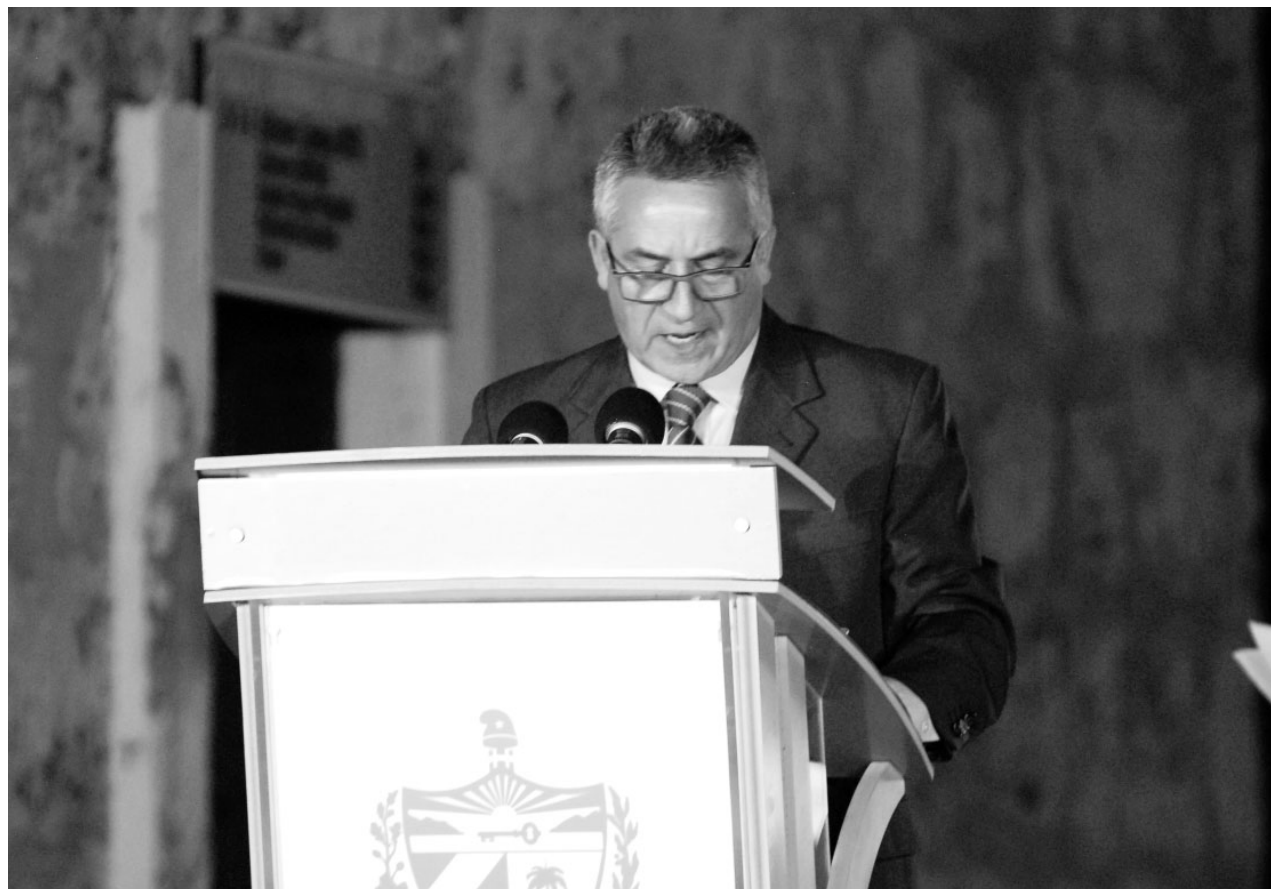
Juan Rodríguez Cabrera, presidente del Instituto Cubano del Libro

Con más de 600 novedades editoriales, FILCuba 2019 mantendrá la entrega de reconocimientos literarios como los premios nacionales de Literatura, de Ciencias Sociales y Humanísticas, Edición y Diseño del Libro, los Premios del Lector, Calendario, entre otros.